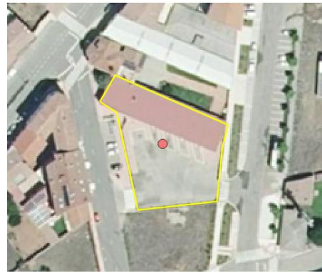
Ejemplo servicio de carretera. /estación de autobús