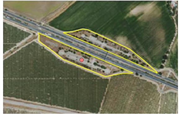
Ejemplo servicio de carretera. /Área de descanso