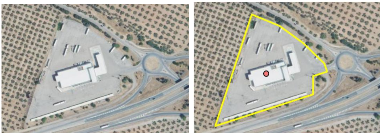
Ejemplo servicio de carretera. /Área de servicio