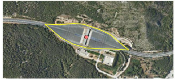
Ejemplo servicio de carretera. /Peaje