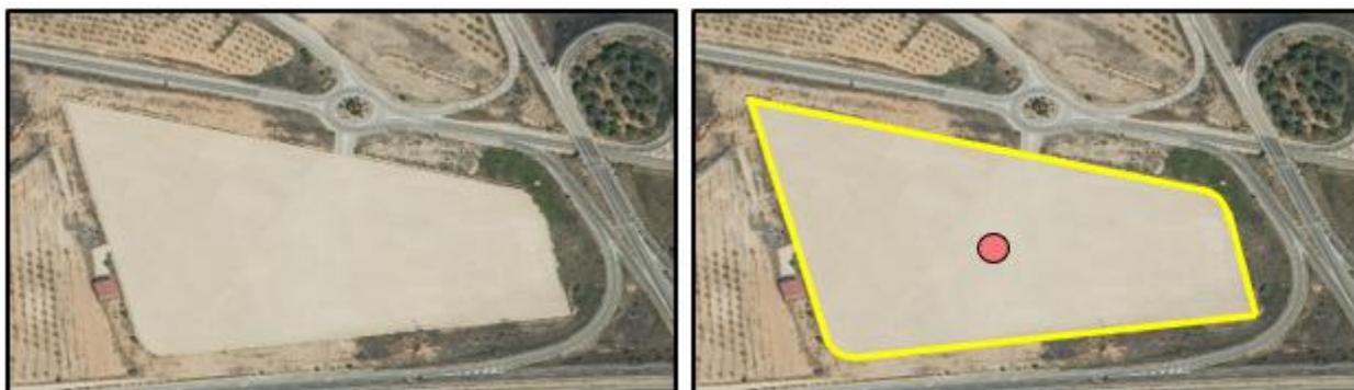
Ejemplo servicio de carretera. /aparcamiento invernadero.