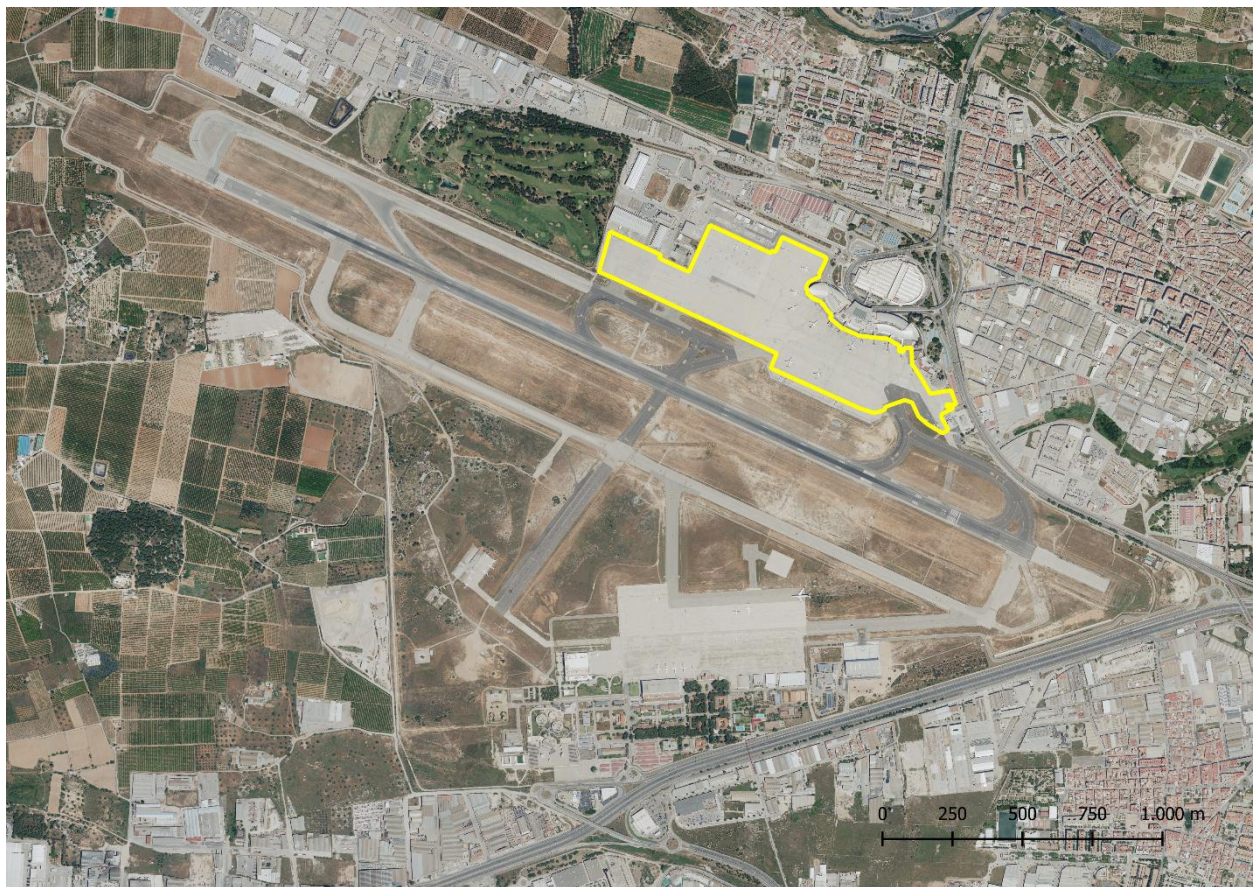
Área de estacionamiento 3