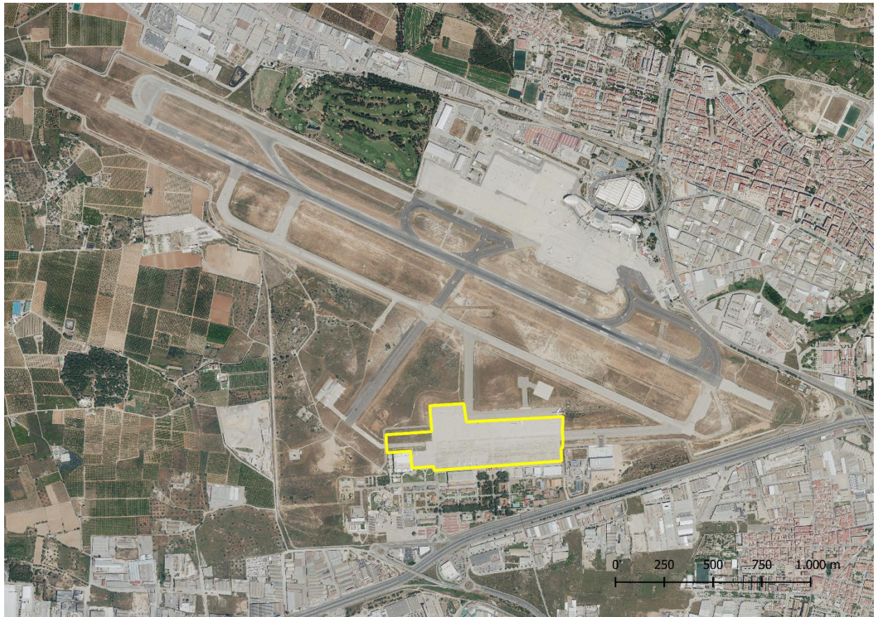
Área de estacionamiento 2