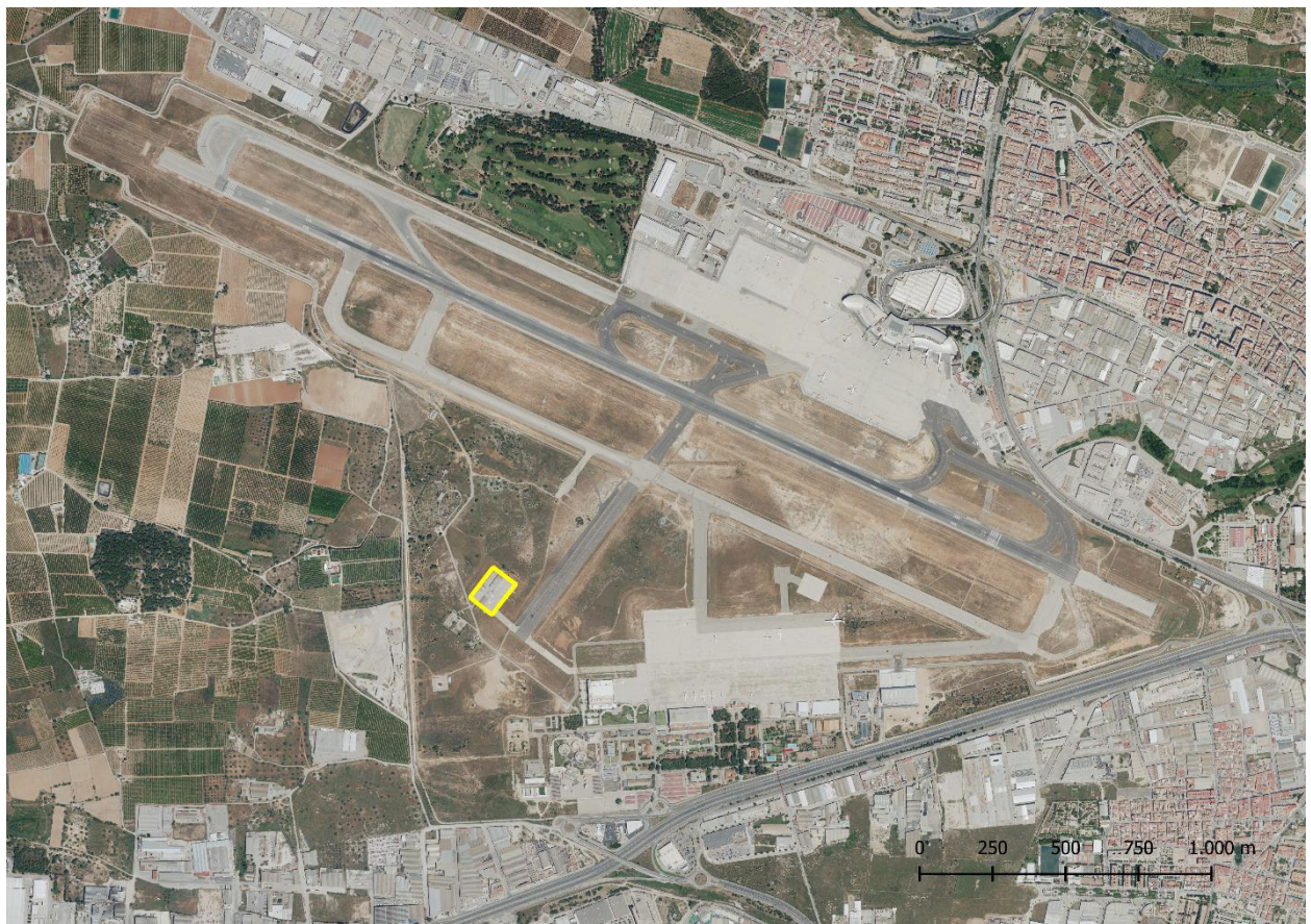
Área de estacionamiento 1