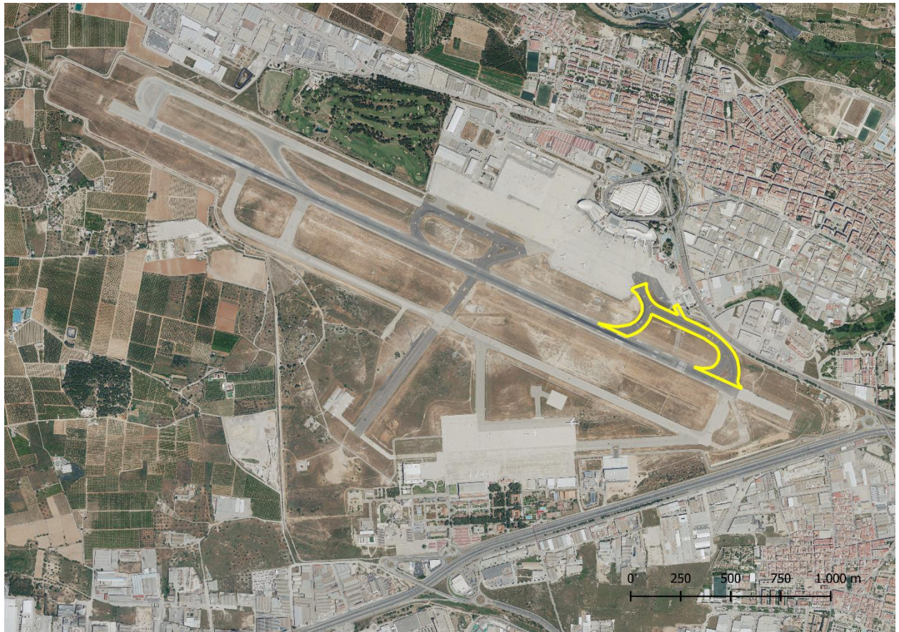
Calle de rodaje 3