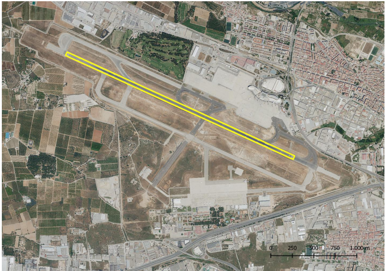
Pista de aterrizaje 2