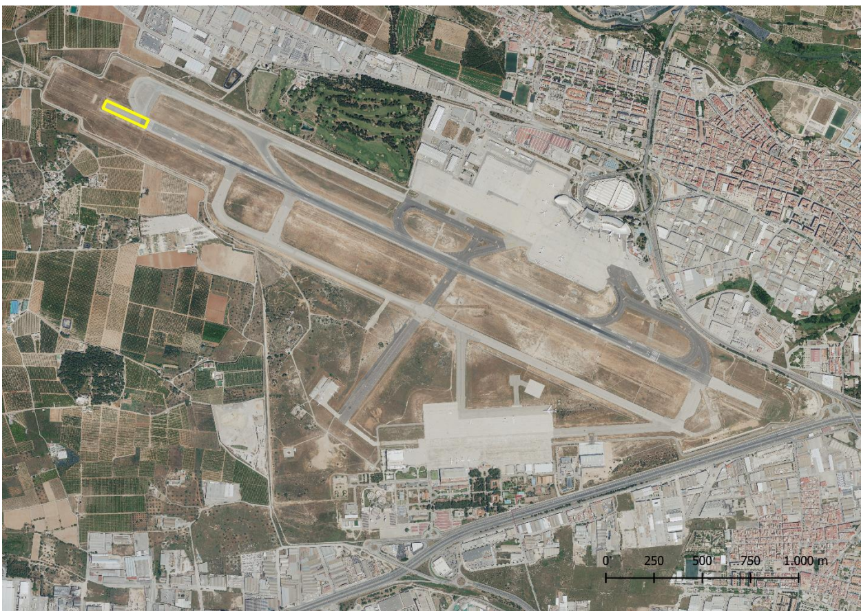
Pista de aterrizaje 1