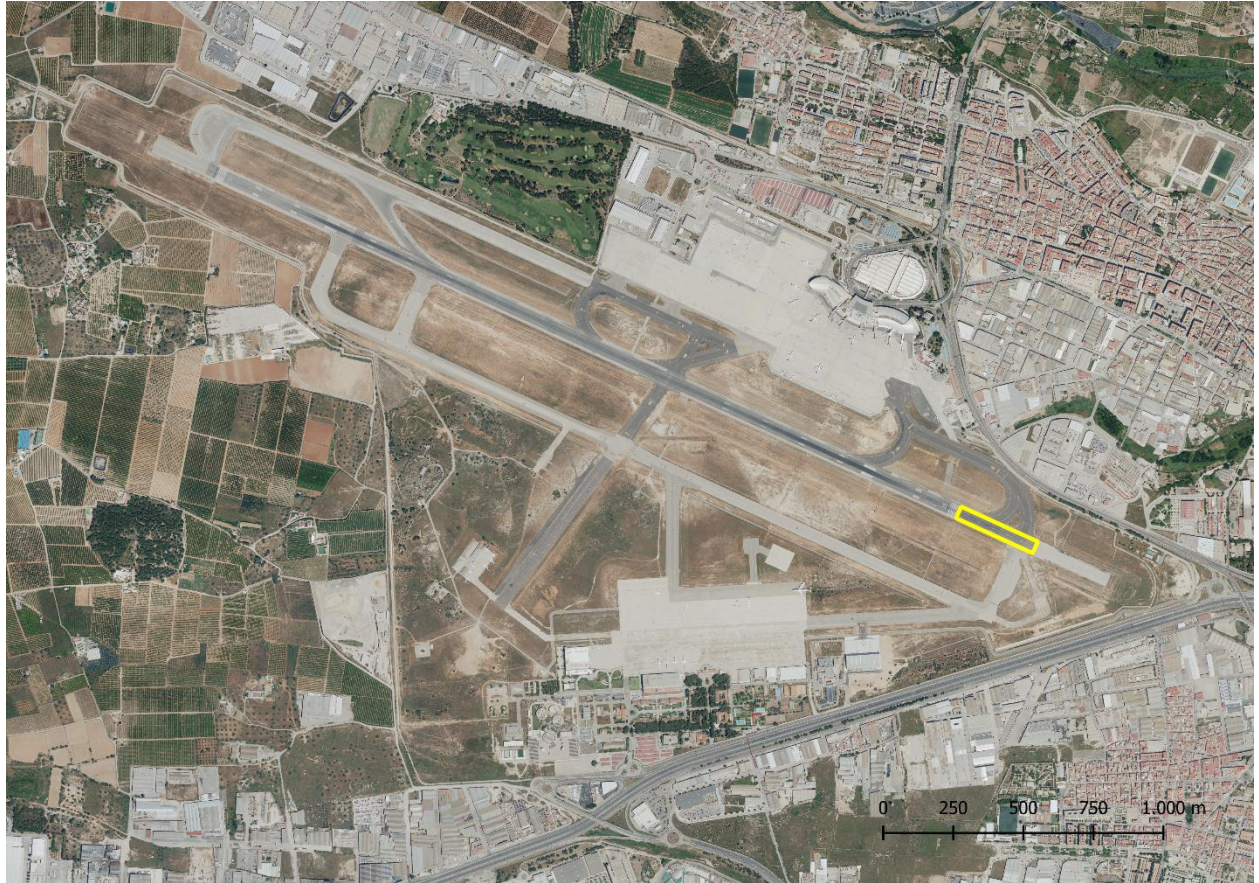
Pista de aterrizaje 3