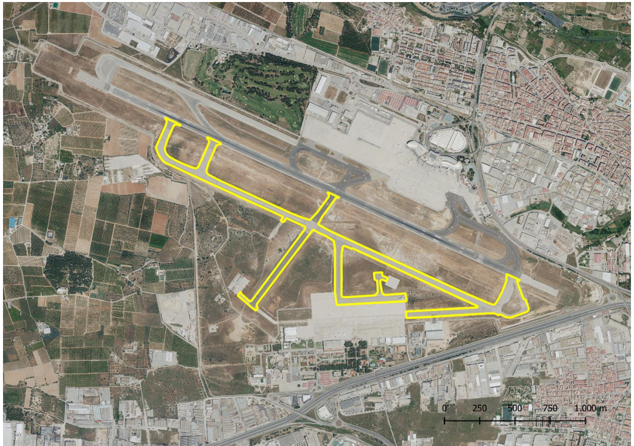
Calle de rodaje 1