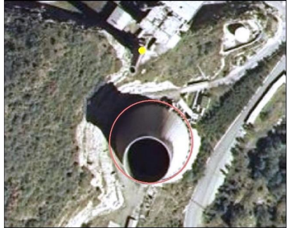
Ejemplo de edificación, atributo TIPO = Chimenea