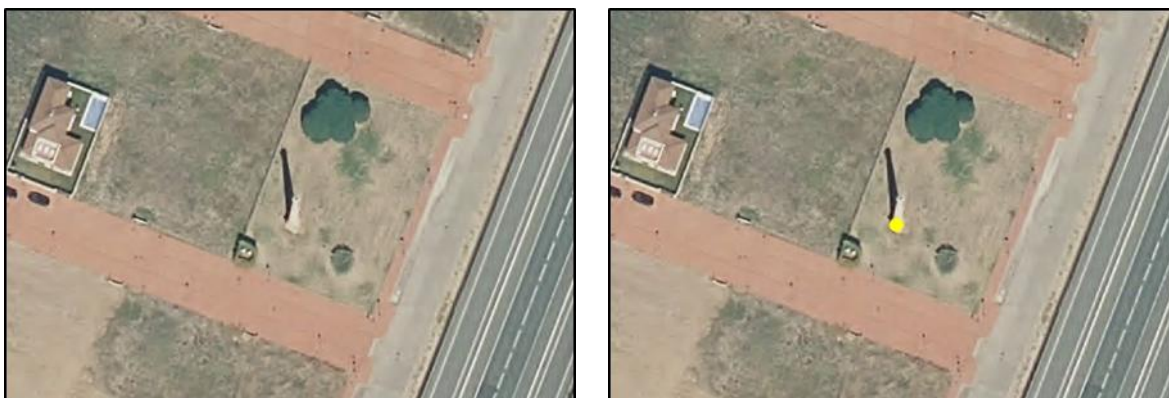
Ejemplo de edificación (chimenea antigua fábrica), atributo TIPO = Chimenea