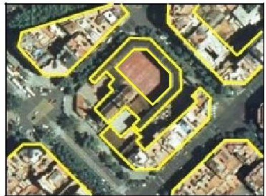
Ejemplos de edificación, atributo TIPO = Genérico