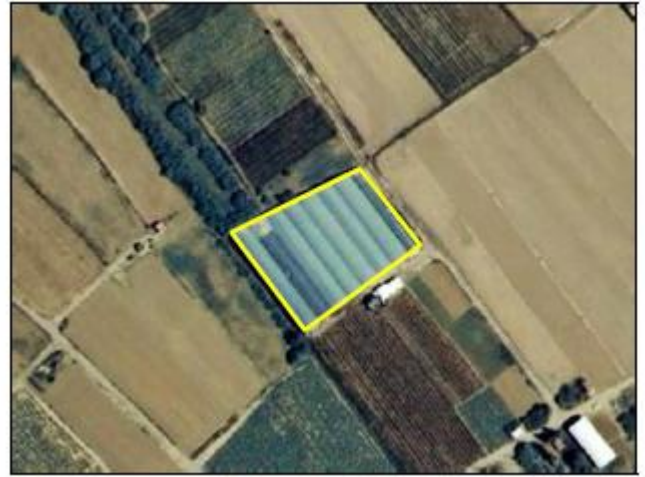
Ejemplo de edificación, atributo TIPO = Edificio ligero, TIPOEX = Invernadero