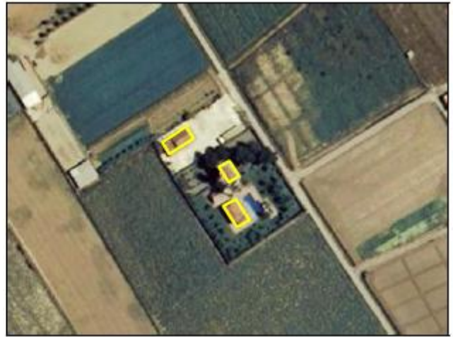
Ejemplos de edificación, atributo TIPO = Genérico