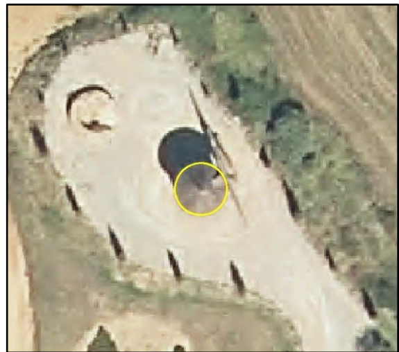
Ejemplo de edificación, atributo TIPO = Molino de viento