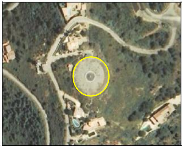
Ejemplo de edificación, atributo TIPO = Faro