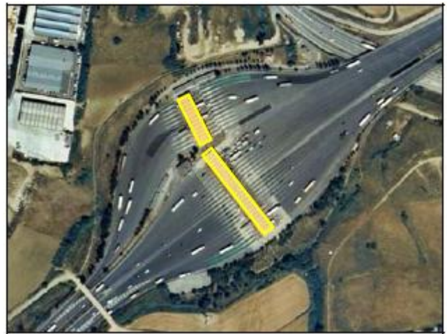
Ejemplo de edificación, atributo TIPO = Edificio Ligero, TIPO_EX= Marquesina