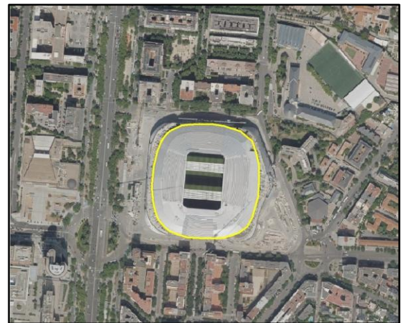
Ejemplo de edificación, atributo TIPO = Estadio