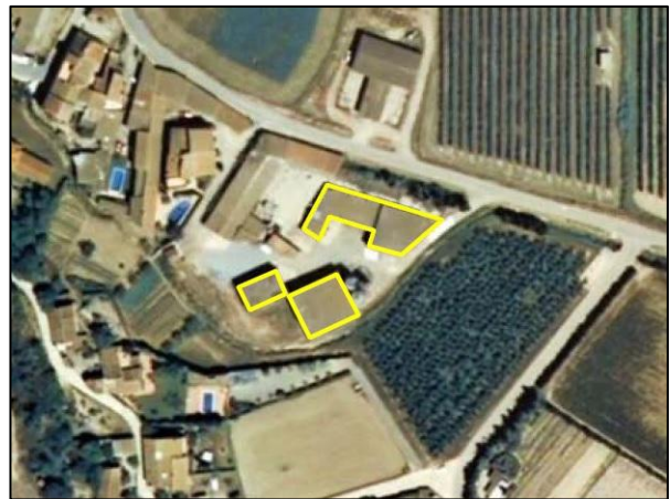
Ejemplo de edificación, atributo TIPO = Edificio ligero, TIPOEX = Nave abierta