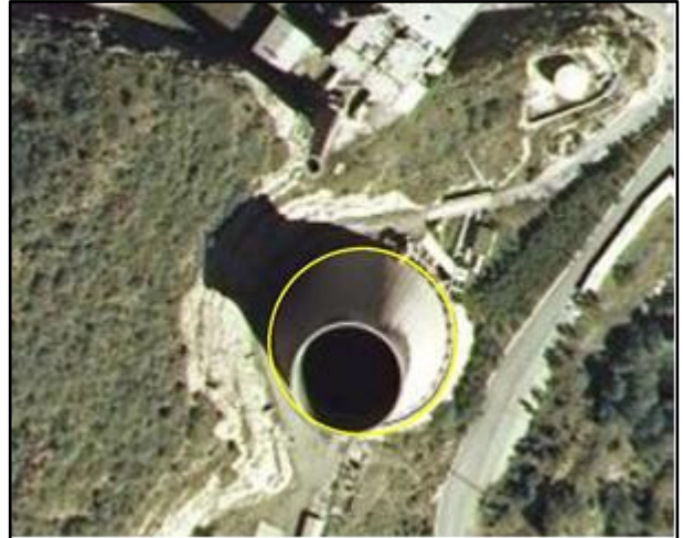
Ejemplo de edificación, atributo TIPO = Chimenea