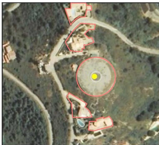
Ejemplo de otras construcciones atributo TIPO = Señal de navegación (en modelo extendido VHOR)