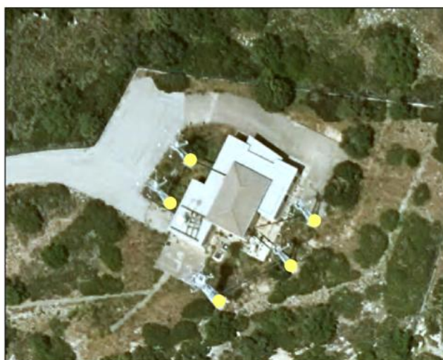
Ejemplo de otras construcciones atributo TIPO = Antena (en modelo extendido antena de comunicaciones)