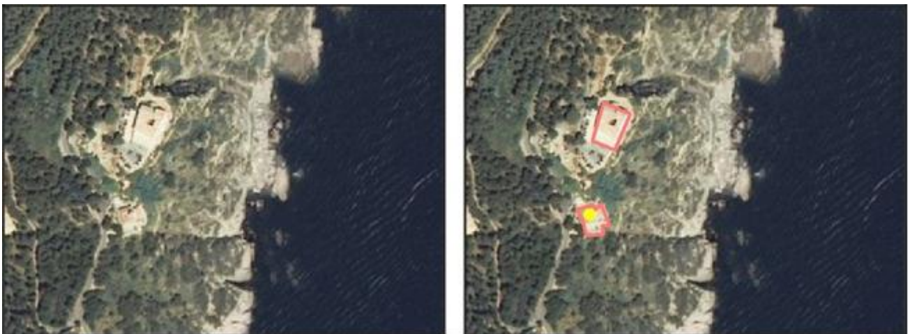
Ejemplo de otras construcciones atributo TIPO = Señal de navegación (en modelo extendido Faro)