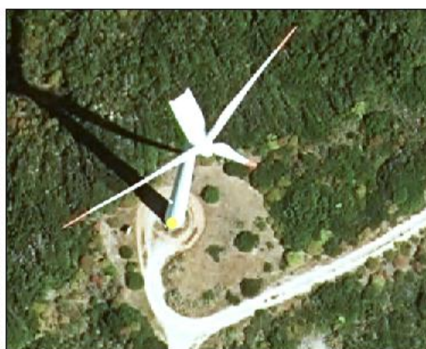
Ejemplo de otras construcciones atributo TIPO = Aerogenerador