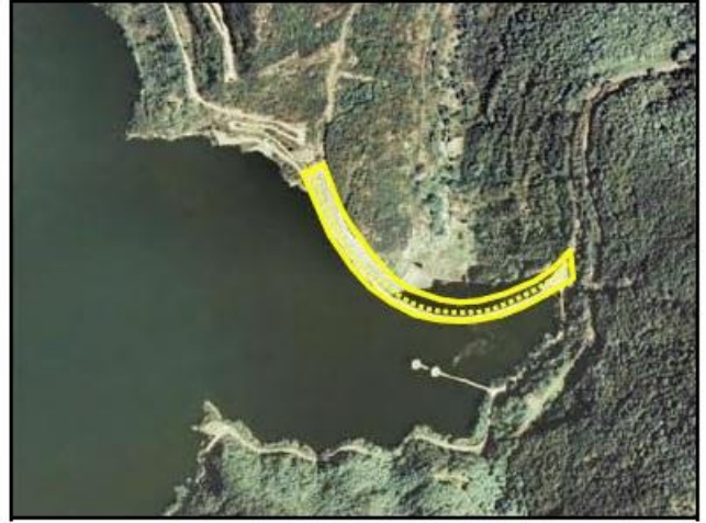
Ejemplos de presa atributo TIPO = Presa