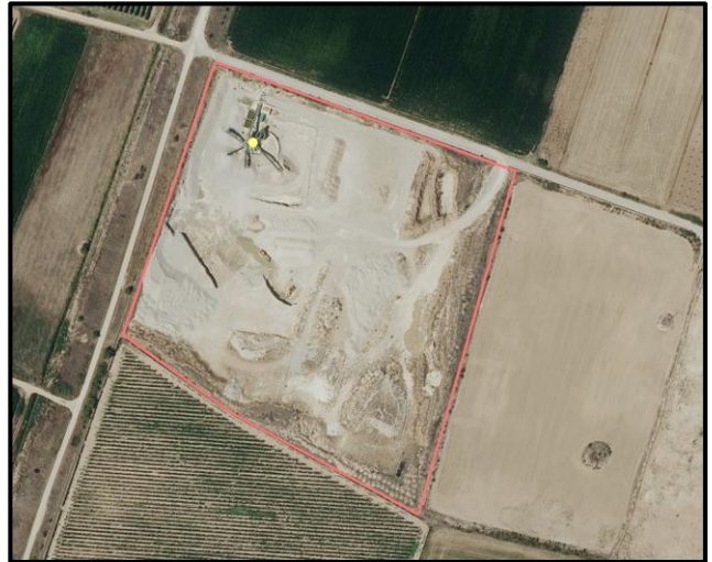
Ejemplo de “/Gravera”