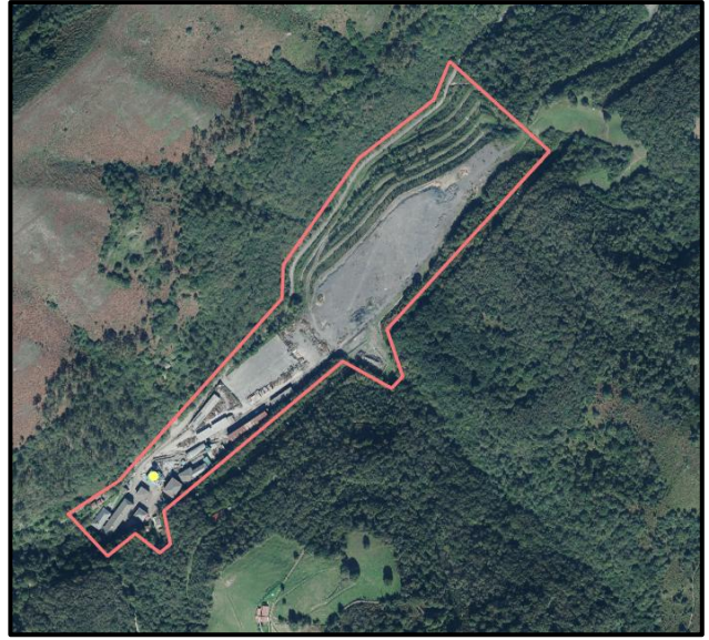
Ejemplo de “/Pozo minería”