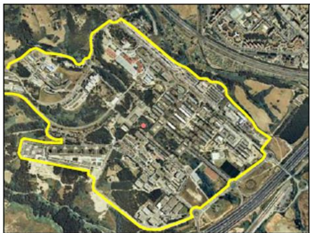
Ejemplo de TIPO “/Educativo”