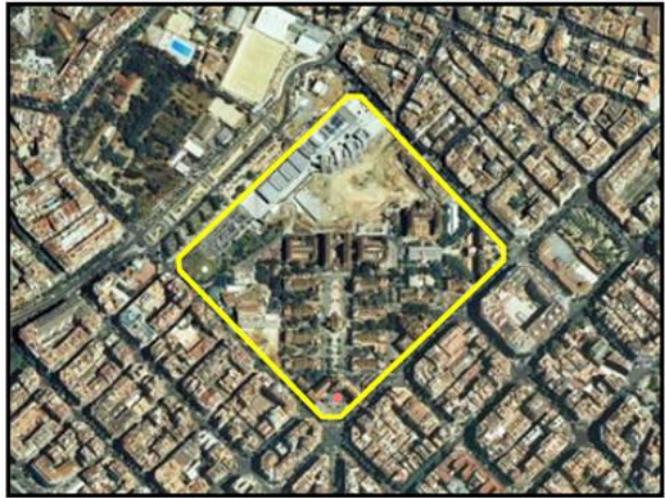
Ejemplo de TIPO “/Sanitario”