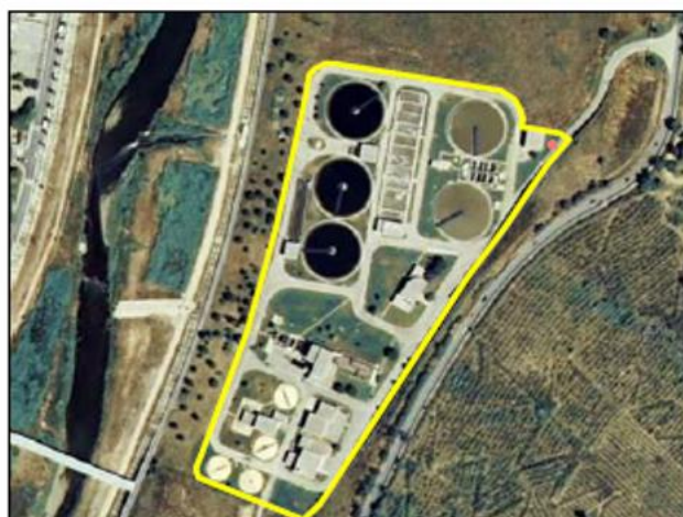
Ejemplo de TIPO “/Tratamiento aguas”