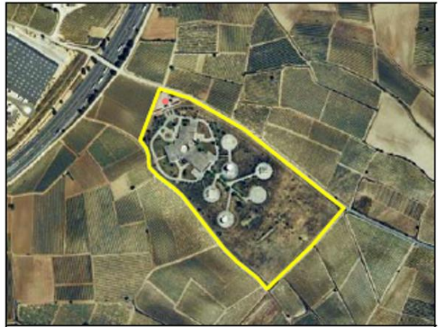
Ejemplo de TIPO “/Instalación de telecomunicaciones”