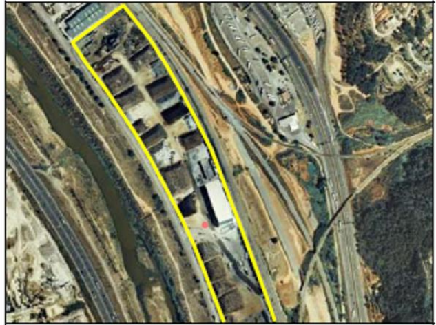
Ejemplo de TIPO “/Gestión residuos”